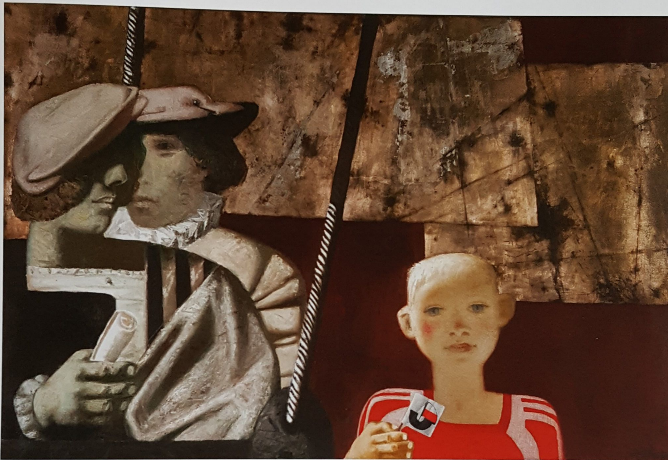
»Kogge der Zeit«